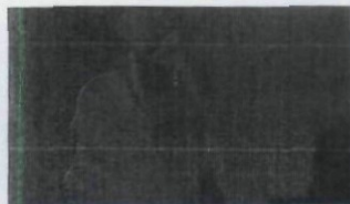
ROT 78 – 93