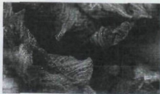
BLAU 18 – 31