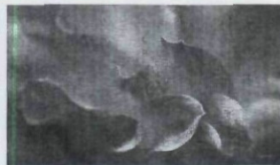
PFIRSICHFARBEN 124 – 137