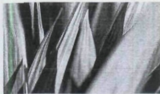
GRÜN 32 – 45