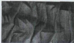
ORANGE 62 – 77