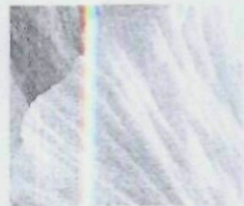
WEISS 38 – 149