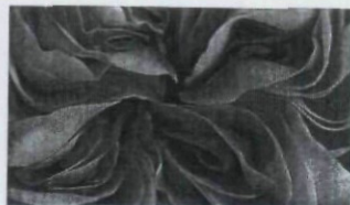
ROSA 108 – 123