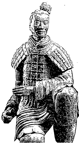
Bogenschütze aus der Terrakotta- armee von Xi'an (S. 299)

Abbildungsnachweis und Verzeichnis der Farbtafeln _____ 325