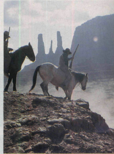
Furchtlose Westernhelden ..... 88

LUKAS LESSING, J. R. HAMILTON (Fotos): Drehorte der großen Western-Filme..... 88