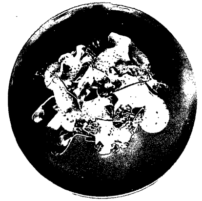
46 LÆKKER ESSEN: Was neu und nordisch auf den Tisch kommt

TITEL: GIOVANNI SIMEONE. KLEINE MEERJUNGFRAU, KOPENHAGEN REDAKTIONSSCHLUSS: 11. JULI 2014