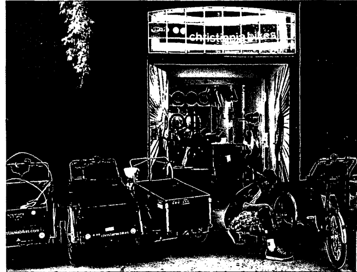
94 UTOPIA IN BESTER LAGE: Unter Aussteigern