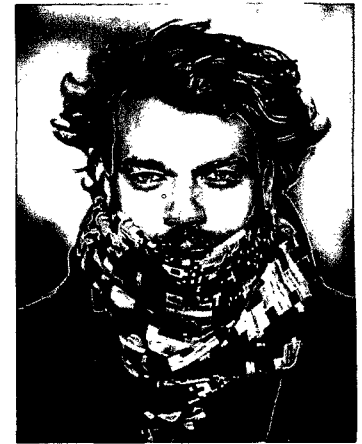
106 MOVER: »Borgen«-Schauspieler Pilou Asbæk