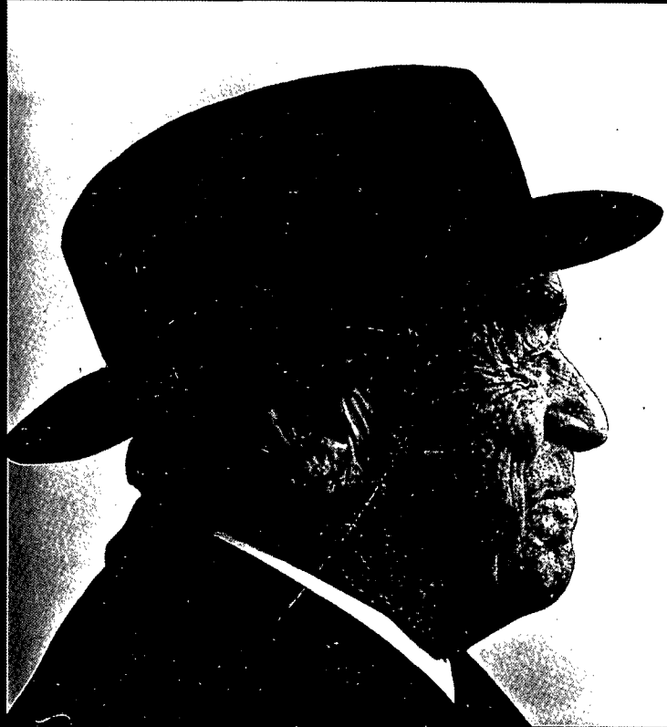
Alvar Aalto