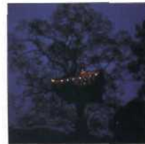
32 GREEN MAGIC NATURE RESORT IN SÜDINDIEN