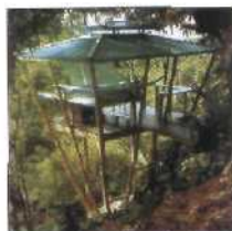
14 BAMBOO HOCH, PUERTO RICO