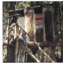
22 THE ELMS IN AUSTRALIEN