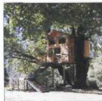
30 OXBOW ANNEX IN OREGON