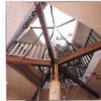
36 EIN BAUMHAUS AUS MISOFÄSSERN