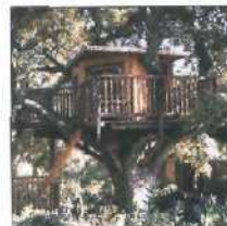
44 DAS BAUMHAUS DER FAMILIE ENGEL