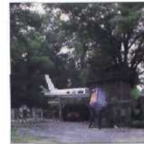
50 SAMS BAUMHAUS