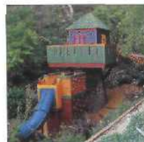
28 CANYON PERCH IN KALIFORNIEN