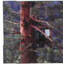
24 MARIAH'S MANOR