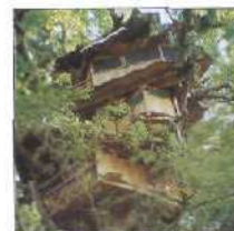
40 DAS DSCHUNGEL-BAUMHAUS