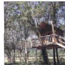
48 OUT 'N' ABOUT RESORT, OREGON