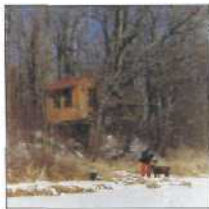
18 DAS TREESNAKES-Projekt IN MINNESOTA