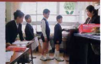
TITELBILD: FUJIT-SAN