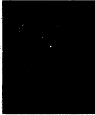
Blüten der Feuerbohne.