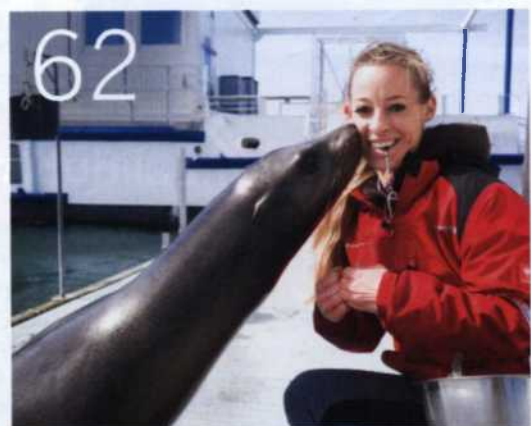
WISSENSCHAFT AM WASSER Dicht am Objekt: Im Robbenforschungszentrum der Universität kommt man den Seehunden ganz nah