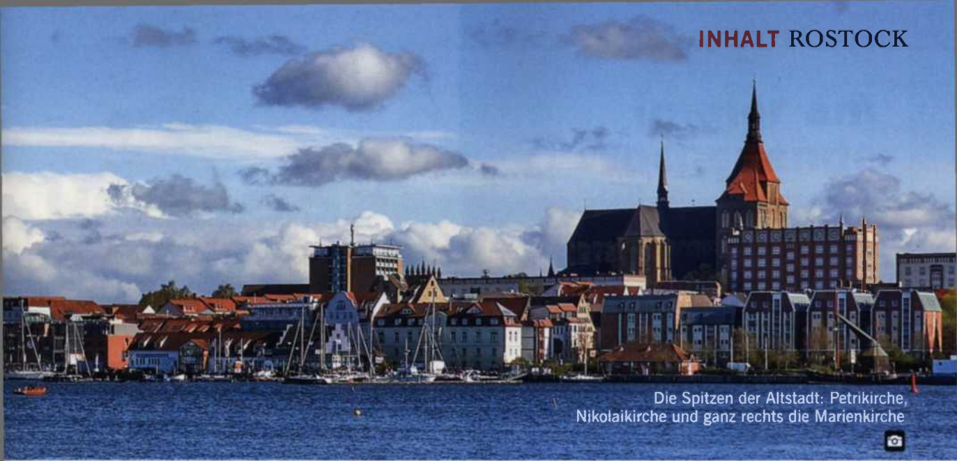
Die Spitzen der Altstadt: Petrikirche, Nikolaikirche und ganz rechts die Marienkirche