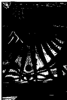
Catedral Metropolitana in Brasília ▶ S. 132