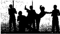
Der afrobrasilianische Kampftanz Capoeira • S. 82